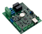
Kontroler dostępu EDC 01L/R LAN/RS 485